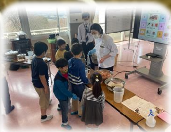
講師：エムサービス株式会社 管理栄養士 https://www.aimservices.co.jp/